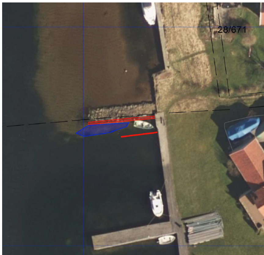
Utklipp fra flyfoto over området. Røde streker = plassering av utrigger og fender, blått felt = plassering av masse som skal forflyttes/mudres