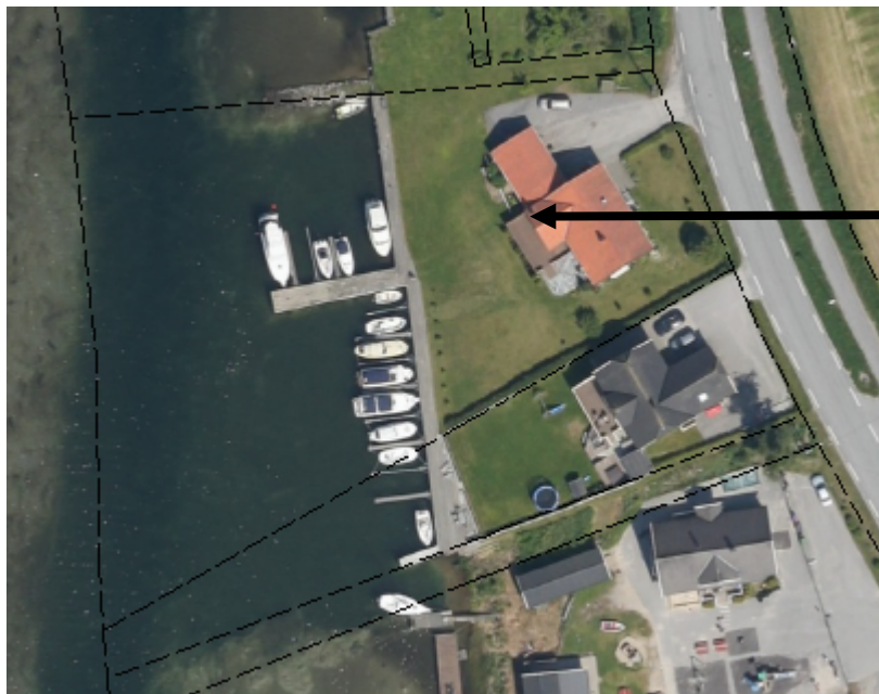
Flyfoto fra 2014 viser et større antall båtplasser på eiendommen, GB 28/20 er markert med pil

Flyfoto av området fra 2014 viser at det allerede er etablert et større antall båtplasser på GB 28/20. Utriggeren og fenderen som det søkes om dispensasjon for å kunne oppføre, vil tilføre ytterligere én båtplass til dette. Båtplassene som allerede er anlagt på eiendommen medfører at området allerede fremstår som delvis privatisert og etter administrasjonens mening vil ikke etablering av ytterligere én båtplass endre hvordan området fremstår i vesentlig grad. På bakgrunn av dette kan vi ikke se at å innvilge dispensasjon for omsøkte uttrigger og fender vil føre til at formålet bak byggeforbudet langs Lundeelva i vesentlig grad blir tilsidesatt.